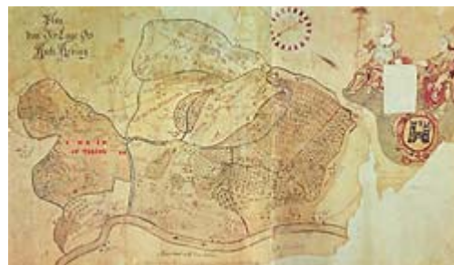
Plan von der Lage des Amtes Aarburg (Museum Aarburg)

Im Mittelalter gehörte Oftringen unter den Froburgern und deren Nachfolgern, den Habsburgern, zur Herrschaft Aarburg. Zur Zeit der Berner Herrschaft, von 1415 bis 1798, bildete es einen Bestandteil des Amtes Aarburg. Oftringen hat bis ins 20. Jahrhundert hinein keine eigene Kirche besessen und war somit keine selbständige Kirchgemeinde. Betreut wurde Oftringen durch das Chorherrenstift Zofingen, wohin die Oftringer auch kirchgenössig waren. 1528 führten die Berner in ihrem gesamten Untertanengebiet die Reformation ein und so wurde auch Oftringen protestantisch.