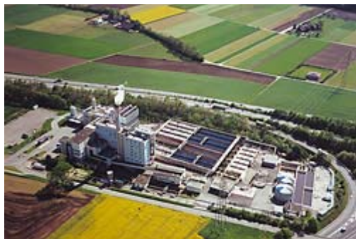
Kehrichtverbrennungs- und Kläranlage Alte Strasse 30

Dorfkern selber wie auch an den Autobahnzufahrten, niedergelassen. Dementsprechend wuchs auch die Bevölkerung mehr oder weniger kontinuierlich an. Markante Wachstumsschübe brachten nur die Jahre der Hochkonjunktur von 1950 - 1970, während die Rezession der 70-er-Jahre einen leichten Rückgang bewirkte. Seit Mitte der 80-er-Jahre ist wiederum eine leichte jährliche Zunahme der Bevölkerung festzustellen. Am 1. Dezember 1995 wurde die Schallgrenze von 10'000 Einwohnern erstmals erreicht und in den nachfolgenden Jahren deutlich überschritten.