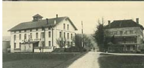
oben: Papierfabrik Walty & Co. im Jahr 1920 unten: Erster Fabrikbau der Plüss-Staufer AG