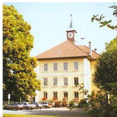
Das erste Oftringer Schulhaus im Dorf

Im Bereich der Betagtenbetreuung hat Oftringen mit dem modern konzipierten Alterszentrum Lindenhof vorbildliches geleistet. Die unter privater Trägerschaft stehenden Spitexdienste werden bedürfnisgerecht ausgebaut und von der Gemeinde auch finanziell unterstützt.