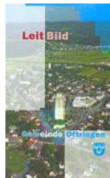
Leitbild Gemeinde Oftringen

Nach den rezessiven 90-er-Jahren mit einer angespannten finanziellen Situation ist mit Beginn des neuen Jahrtausends der langersehnte wirtschaftliche Aufschwung Tatsache geworden. Damit stiegen nach einer langen Durststrecke die Chancen der Gemeinde, ihre Standortgunst zu nutzen und neue Betriebe anzusiedeln. Für die Region im Unteren Wiggertal besteht ein beachtliches Wachstumspotential. Die Gemeinde hat in der zweiten Hälfte der 90-er-Jahre ein Leitbild ausgearbeitet, das Vorgaben für die Gemeindeentwicklung in verschiedenen Bereichen des öffentlichen Dienstes macht und die verschiedenen Bedürfnisse der Bevölkerung aufeinander abstimmt. Verschiedene Planungen zu infrastrukturellen Bauvorhaben sind hierfür aber zwingend notwendig.