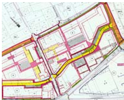
Ausschnitt aus dem Kernzonenplan, rechtskräftig seit 2001

Die Kernzonenplanung ist im Jahr 2001 rechtskräftig geworden. Mit der unmittelbar anschliessenden Landumlegung werden weitere Impulse gesetzt. Die Nutzungsplanungen Kulturland und Siedlung stehen unmittelbar vor ihrem Abschluss. Neue Planwerke wie der Generelle Entwässerungsplan und das Reglement für die Erschliessungsfinanzierung wurden in Angriff genommen. In der Spezialzone an der Autobahn wurden im kantonalen Richtplan die Voraussetzungen für einen Fachmarktstandort geschaffen. Durch die rasante Zunahme des Individualverkehrs ist die Behebung des Verkehrsproblems zum zentralen Anliegen unserer Gemeinde geworden. In der nahen Zukunft stehen verschiedene Verkehrsprojekte an, unter anderem die Wiggertalstrasse, die Kreisell Birchenfeld und Wegweiser und die Sanierung des Knotens Lanz. Im Jahre 2000 hat der Grosse Rat die Festsetzung der Wiggertalstrasse