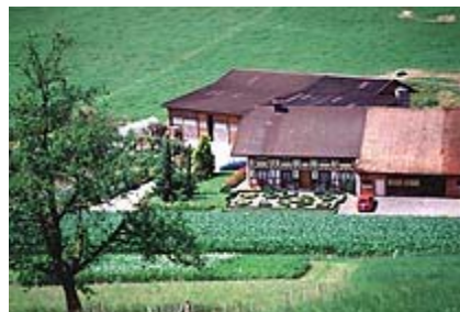
Landwirtschaft und Viehhaltung

Beeindruckend auch das Wachstum des Dienstleistungsbereichs. Die Zahl der dort Beschäftigten stieg in den zwanzig Jahren von 1960 - 1980 auf nahezu das Dreifache an: Im Verkehrsknotenpunkt Oftringen haben sich in dieser Zeit Banken, Einkaufszentren und andere Dienstleistungsbetriebe, sowohl im