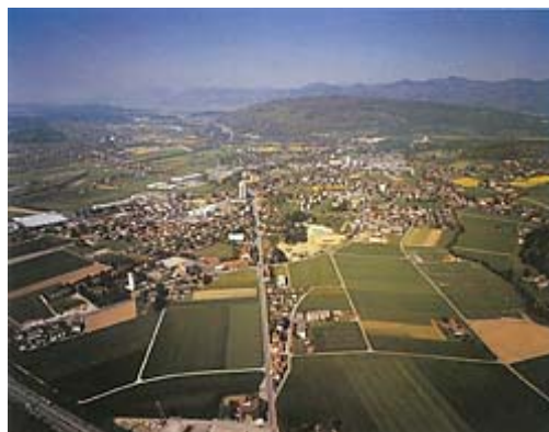
Oftringen im unteren Wiggertal

Aus der Römerzeit ist die weitläufige Anlage eines römischen Gutshofes im Bereich der Kreuzstrasse belegt.